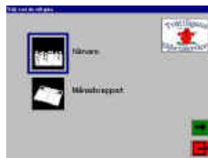
Närvaro- och månadsrapport

Här kan du läsa om bakgrunden till projektet (ta bort som länk) och målgruppen för projektresultatet samt projektrapporten (ta bort som länk) . Här kan du också läsa en artikel (länken funkar inte men byt till länk med artikel: Tvättakta arbetsglädje /från länksidan) från Tvättligans Björnservice. Projektet finns dokumenterad i en videoproduktion som heter " Visuell informationsteknologi i arbetslivet ". Videon är producerad av Studio Korsholm. Målet med projektet är att utveckla datorprogram som ska användas av personer med kognitiva funktionshinder i arbetslivet.