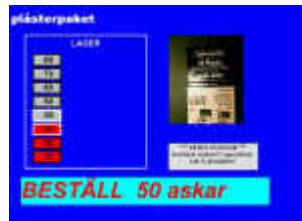
Beställ antal produkter

Visuell Lagerhantering är en arbetsmodell, som bygger på bilder för att göra arbetsuppgifter konkreta och tydliga för personer med olika funktionshinder.