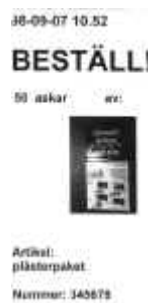
Skriva ut beställningen

Arbetsmodellen, som innefattar lagerprogrammet FlexiLager, kan tillsammans med olika styrsätt skapa möjligheter för personer att självständigt sköta lager och förrådshantering och få en aktiv del i en arbetsuppgift, som annars kan vara komplex och svårförståelig.